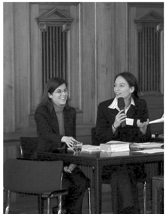
Übersetzung während der gesamten Veranstaltung / translation during the entire event: Isabel Netzeband, Gwen Walka

12.30 Imbiss und Abreise / Snack and departure